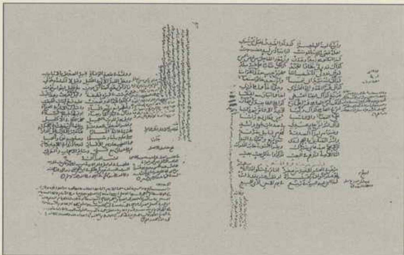
راموز الورقة الأخيرة للنسخة (ب)