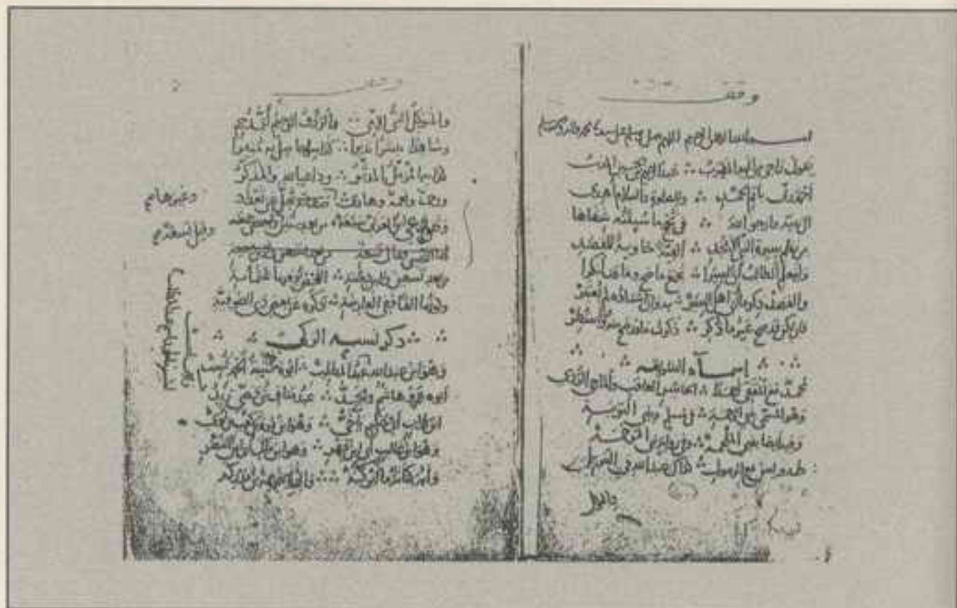
راموز الورقة الأولى للنسخة (أ)