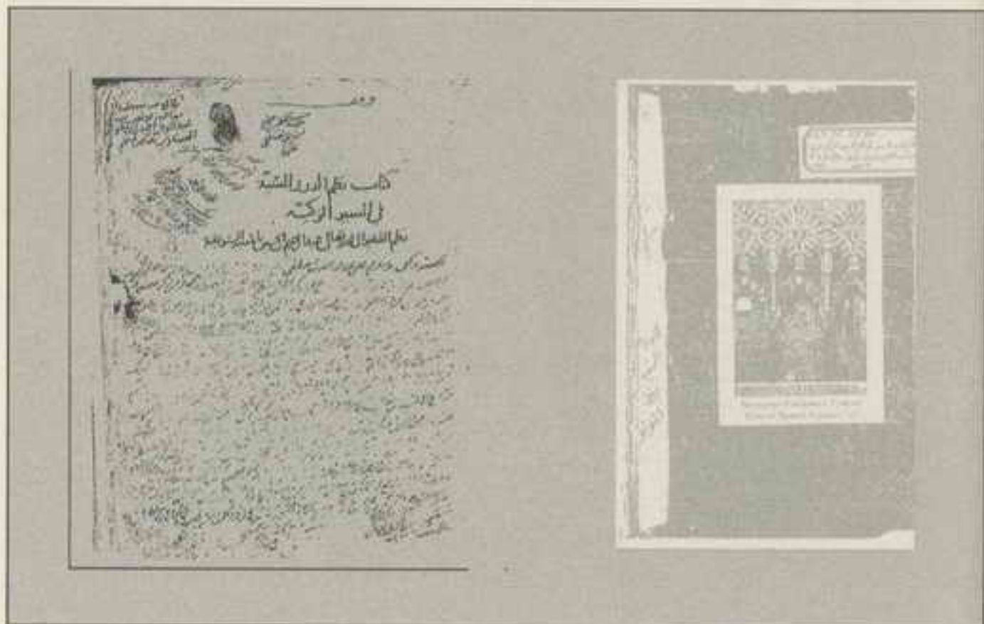
راموز ورقة العنوان للنسخة (أ)